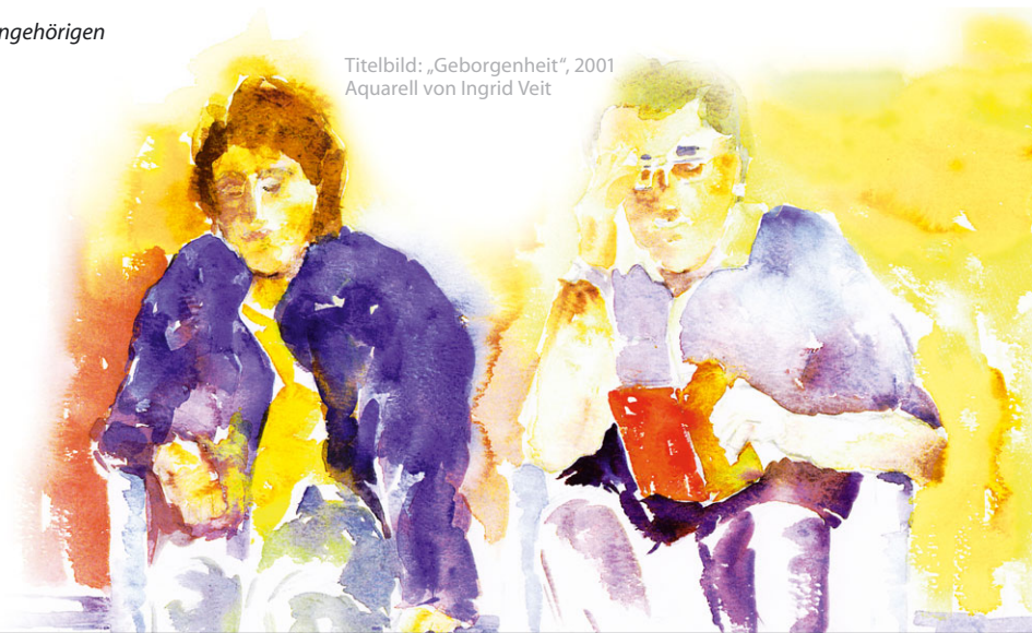
Titelbild: „Geborgenheit“, 2001 Aquarell von Ingrid Veit

Die Innenstädte Heiligenhafens und Neustadts sind zu Fuß ca. 20 Minuten entfernt und es bestehen direkte Linienbusanschlüsse. Heiligenhafen und Neustadt bieten in unmittelbarer Nähe zur Ostsee zahlreiche Freizeitangebote . Jährlich wiederkehrende Veranstaltungen, Hafen- und Strandleben sowie die Feste der psychatrium GRUPPE sorgen für Unterhaltung.